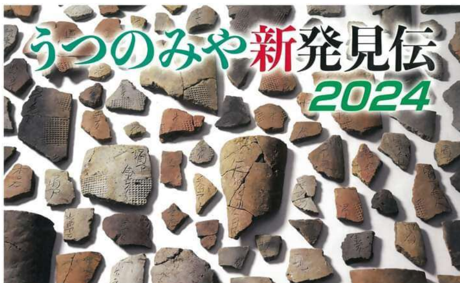
上神主・茂原官衙遺跡出土刻書瓦（国指定重要文化財）