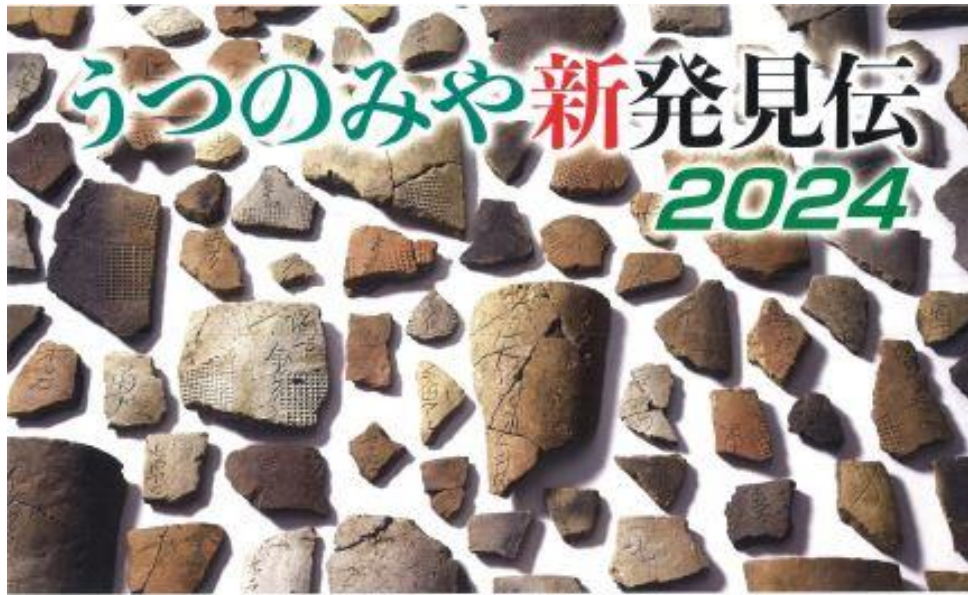
上神主・茂原官衙遺跡出土刻書瓦（国指定重要文化財）