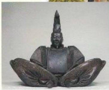
伝源頼朝坐像(東京国立博物館蔵)