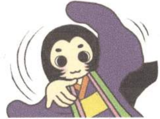
うつのみや百人一首マスコットキャラクター みやびい

発行：うつのみや百人一首市民大会 実行委員会事務局 (宇都宮市教育委員会文化課内) Tel.028-632-2763 第2号 平成29年2月13日