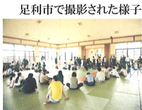
足利市で撮影された様子