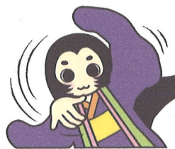
うつのみや百人一首マスコットキャラクターみゆひ